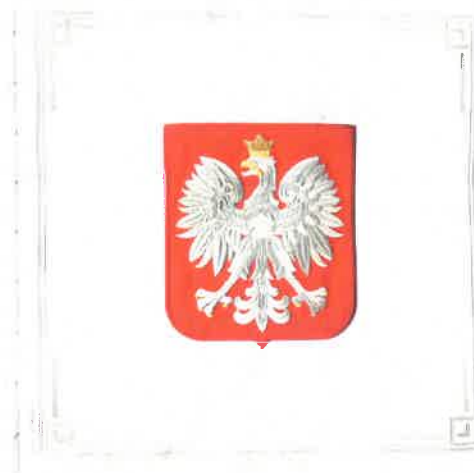
Sztandar – strona 2